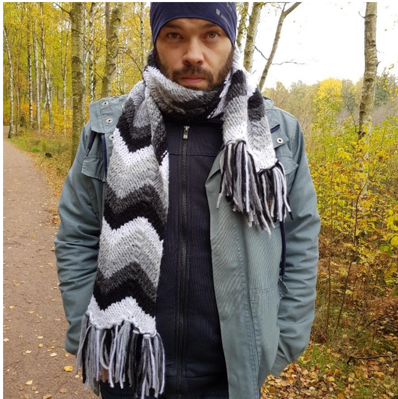
Trött pappa som matar bäbis varannan timme...

Fäst alla trådar och blocka halsduken (jag tyckte att det behövdes). Gör fransar, ca 13 cm långa (när de är vikta, alltså behövs ca. 26 cm långa garnbitar).